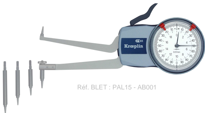
Réf. BLET : PAL15 - AB001

Les contrôleurs Intérieurs KROEPLIN permettent la mesure mécanique par comparaison grâce à une touche sphérique à baïonnette modulable, à des diamètres divers et amovibles selon la surface et la matière concernée.