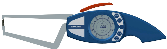
Réf. BLET : PAL15 - DT002

Les palpeurs rapides KROEPLIN à affichage analogique ou digital existent en version dédiée pour parois de tube ou de tuyaux, avec touches fixes ou mobiles de formes et tailles variées et avec des possibilités de grandes profondeurs de bras.