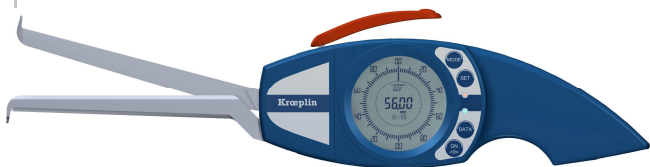
Réf. BLET : PAL15 - DI004